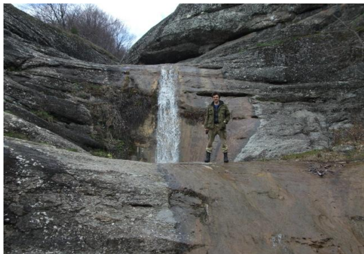
У водопада Джурла

водопаде нет. Симпатичное, конечно, местечко, но в Крыму, с его недостатком воды, относится к одному из самых интересных достопримечательностей. Особенно привлекла внимание одна группа с маленькими детьми, один из которых выглядывал из рюкзака за спиной папаша. Летом, кстати, водопад прекращает своё существование вследствие пересыхания реки Джурла .