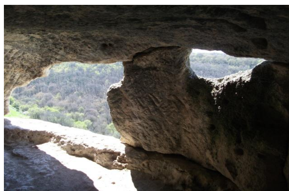
В одной из «квартир» Чуфут-Кале

В Чуфут-Кале, в отличие от многочисленных иностранных туристов, мы попали от кладбища по верхней тропе. В жилищах, вырубленных в скалах, прохладно, как в склепах. Некоторые «квартиры» многоэтажные. Сохранился мавзолей дочери Тохтамыша — хана Золотой Орды. Интересно, что золотоордынцы в течение 6 месяцев не могли взять Чуфут-Кале, и удалось это им только после того, как отравили колодец — бросили туда дохлого верблюда. Два часа я лазил по этим пещерам, напугав каких-то старух-француженок, так как снимал видео, комментируя его своим мистически-загробным голосом: “О-о-о! Чуфут-Кале!» А старухи в этот момент имели неосторожность заползти в ту же пещеру. К счастью, француженки оклемались, и международного инцидента не случилось. Чуфут-Кале единственный пещерный город, посещение которого платно. Таких городов в окрестностях Бахчисарая много, между ними всего несколько километров, но чтобы ознакомиться хотя бы с частью из них, надо совершить отдельный, хотя бы недельный поход.