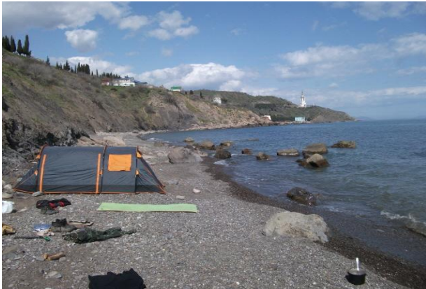
На пляже в Солнечногорском