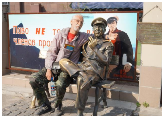
Один из памятников Харькова

P.S. Крым — своеобразно интересный район, доступный и разнообразный достопримечательностями, как географическими, так и историческими. Честно говоря, я влюбился в эту страну, и, пожалуй, буду мечтать ещё раз там побывать.