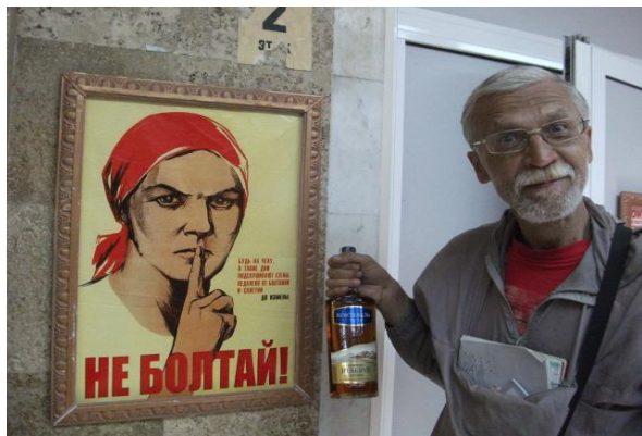
В столовой СССР

Проснулись в Харькове, где нам предстояло торчать весь день. Харьков — это уже настоящий столичный город с метро. И народ одет уже вполне по-столичному. Отраднo, что мне удалось отыскать все памятники, с которыми советовал познакомиться Интернет. Но бродить по городу весь день — гораздо утомительнее, чем идти по горной тропе с рюкзаком.