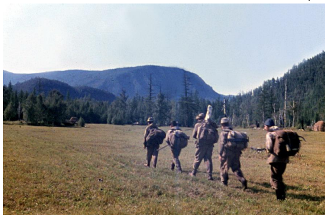
Группа на марше

Учитывая всё вышесказанное, мы в 1972 году решили пройти горно-пешеходный линейный маршрут через самый центр Саян с востока на север, т.е. из Орлика в Алыгджер. Маршрут получился очень длинный (более 530 км) и очень продолжительный (почти месяц). Ненаселённость и дикость района обусловили чудовищный стартовый вес рюкзаков (более 40 кг). Начало маршрута было уже знакомо: поезд - Слюдянка – Кырен – самолётом в Орлик. Из Орлика на пароме переправились через Оку и, перевалив через высокий боковой отрог, двинулись вверх по долине Тиссы. Красоты района поражают с первых километров пути. Озёра, водопады (один из них, Дабэатэ – высотой почти в сто метров). Любоваться не очень получается, так как пот заливает глаза. Идём по правому берегу Тиссы, где проходит конная тропа на ячью ферму. Ферма расположена на притоке Тиссы реке Саган, между озёрами Шутхулай-нур и Дозор-нур. Рыба ловится на искусственную мушку в количествах, достойных рыбацкой байки. Вот и ферма. По склонам бродят добродушные лохматые животные, которых пастухи доят, и из очень жирного молока делают сыр и масло. В тот год в пензенском цирке гастролировал аттракцион «Яки и овчарки», в котором этих симпатяг выставляли какими-то монстрами.