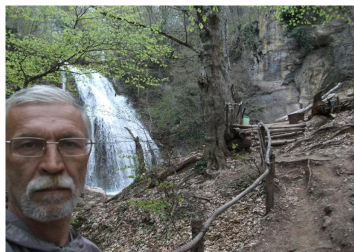
У водопада Джур-Джур