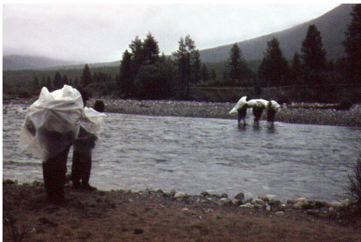
Вода сверху, вода снизу

Отсюда наш путь лежит в так называемую долину вулканов. За невысоким перевалом на десятки километров раскинулось застывшее лавовое поле. Пейзаж очень мрачный. Всё чёрное. Под ногами спёкшаяся лава. Видны многочисленные разрушенные кратеры. Вот и правильные конусы вулканов Кропоткина и Перетолчина. Вулканы относительно невысокие, но подъём на их вершины очень трудоёмок: лезешь вверх, а склон под тобой сползает вниз. Сверху вид такой же безрадостный. На километры чёрная безжизненная пустыня с редкой растительностью. По границе лавового поля громадный водоём. Это озеро Хаара-нур (Чёрное озеро). Идти по лаве очень тяжело. Застывшие глыбы заставляют лезть то вверх, то вниз, и до самого горизонта глазу не за что зацепиться. Но всё когда-нибудь кончается. Кончилось и это чёрное безмолвие.